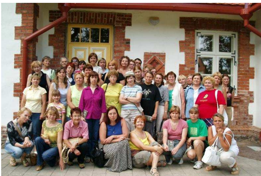
ILU MEIE ÜMBER: Tartumaa raamatukogurahvas poseerib hingematvalt ilusasse Luke mõisaparki taasrajatud kärneri maja ees.