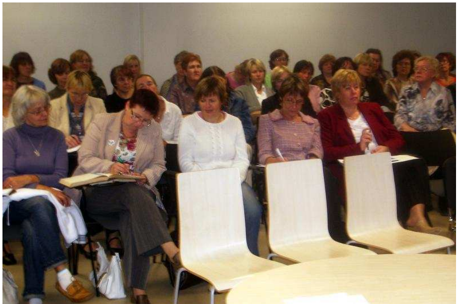
MÖTTETÖINE KOKKUSAAMINE ELVAS: Tänavusele lasteraamatukoguhoidjate päevale kogunes ohtrasti (67!) aktiivseid ja teotahelisi kolleege.