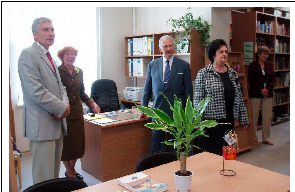
SOE JA SÕBRALIK VESTLUS: Härma raamatukogu renoveeritud ruume külastas piduliku avamise päeval ka president Arnold Rüütel.

Presidendipaar ja teda saatvad isikud külastasid tol päeval muuhulgas ka meie raamatukogu.