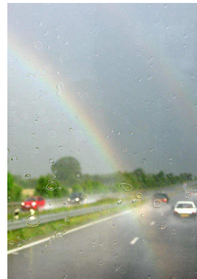
HEA ENNE: Viisakas Prantsusmaa tervitas reisiseltskonda vikerkaarega.

Süingete müüridega piiratud mereäärset St. Malo'd on nimetatud korsaaride ja