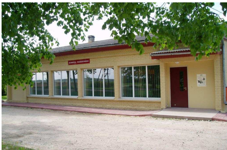
RAAMATUKOGU KODUKS SAI KAUPlus: Kui kellelgi on üle pika aja taas Kurekülla asja ja ta juhtub harjumuspäraselt kauplusesse põikama, tabab teda suur üllatus – kenasti remonditud ruumid on täidetud üksnes raamaturiiulitega –, sest alates 26. maist tegutseb kunagise poe hoones raamatukogu.

Oma silm on kuningas ka huviväärses Tartu vallas lk 3