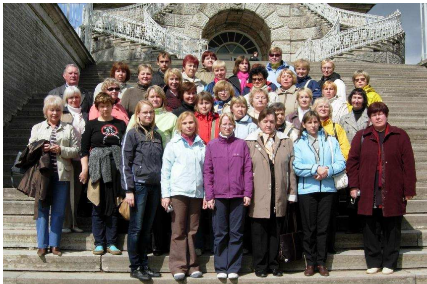
TASUB TUTVUDA: Lääne-Virumaa raamatukoguhoidjad veendusid omal nahal, et Venemaa on riik, mis pakub (ka raamatukogudes!) elamusi seinast seinast.

Interjäär oli kõike muud kui hubane – riulid lääpas ja lagunened, raamatud vana-d, sildid kulunud, kardinat pleekinud.