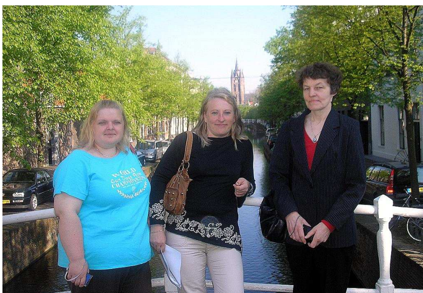
VÕROKESED TULPIDEMAAL: Hollandi Raamatukogude Ühingu toel toimunud õppipäevad andsid ohtralt häid ideid ja vapustavaid muljeid.