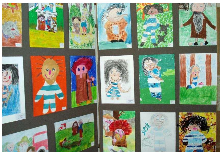
SIIN ME OLEME: Rannu raamatupeole lisasid meeleolu ja silmailu Eno Raua lustlikud tegelaskujud Tartumaa laste poolt joonistatuna.