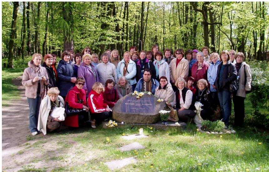
HARDUSHETK: Tartumaa raamatukoguhoidjad tõid Riiga Jakobi kalmistule Kristjan Jaak Petersoni sümbolse hauatähise juurde lihtsad põllulilled, mis kasvanud tema alma materi Tartu ülikooli kodumaakonnas.

Et reisikihk ka teiste maakondade raamatukogurahvast Niperinaadina vähemalt korra hulkuma sunnib, on selgesti näha selle lehe järgmistelt külgedelt.