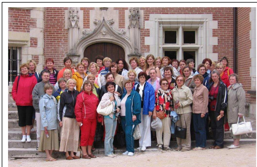
KAUGED AJAD, UHKED LOSSID: Jõgevamaa raamatukoguhoidjate ja nende sõprade seltskond nautis nii Prantsuse arhitektuuri ilu kui kirjandusloost rikkust.

Leonardo da Vinci elas ja töötas oma viimastel eluaastatel Loire'i orus. Kuningas Francois I andis tema käsutusse väikese Clos-Lussé lossi, kus tänapäeval on avatud kunstniku majamuseum. Siin hoitakse tema käsikirjade kollektsiooni ja tema kui leiutaja jooniste järgi valmistatud masinate mudelid. Kõnnime Leonardo ajastut kajastavates eluruumides,