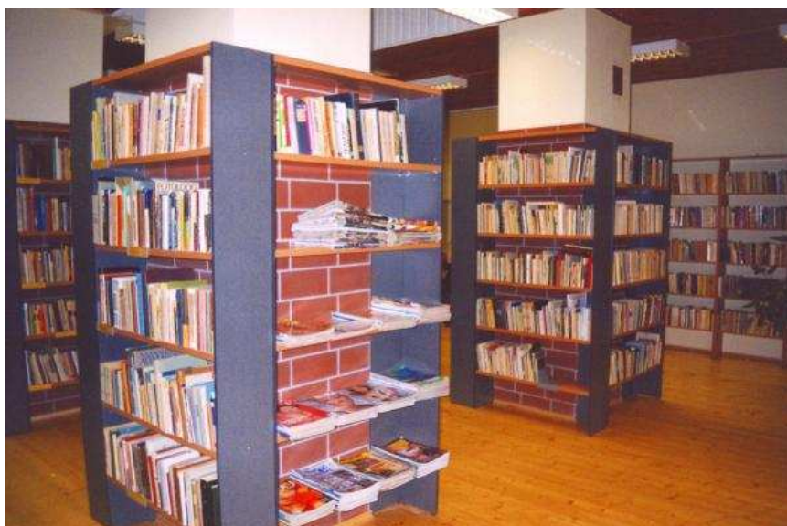
SU RIIULID SEISMAS ON SIRGES REAS: Luunja uues raamatukoguhuones äratab tähelepanu maitsekas ja hubane sisekujundus.

Valik raamatukogupäevade üritusi Tartumaal lk 15