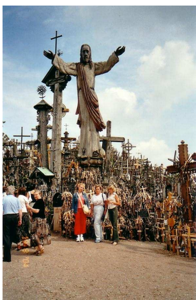
LEEDULASTE PÜHAPAIK: Ristide mäel on tõenäoliselt mitu miljonit risti, mis mõjuvad müstiliselt ja imettegevalt.

Siia tulek on igale leedulasele tähtis ja püha.