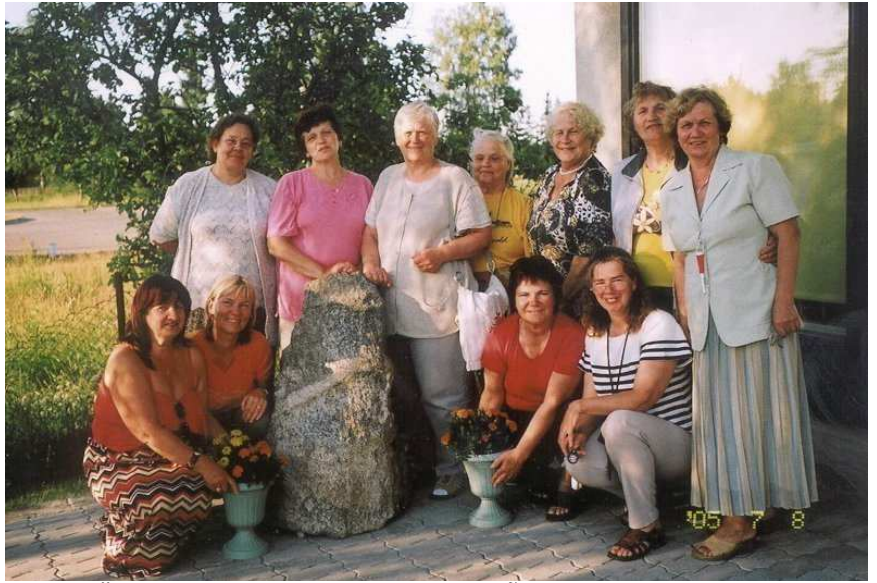
FOTOMÄLESTUS KULTUURILOOLISEST RÕNGUST : Grupp laagrilisi Rõngu raamatukogu kivi juures.

Hommik algas tõeliselt suurte lindude – jaanalindude – elu ja käitumise jälgimisega Ants Karro ökotalus. Nauditav elamus oli silitada jaanalinnumuna ning kinnitada ilus sulg kübarale või rinda.