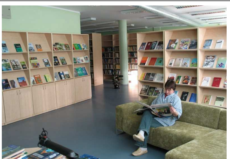
PÜÜAB PILKU: Kambja koolimajas uue kodu leidnud raamatukogus on palju avarust nii raamatutele kui lugejatele.

Koolimajas tegutsemist jätkav rahvaraamatukogu (asutatud aastal 1913) täidab ka likvideeritud kooliraamatukogu ülesandeid. Raamatukogu koosseisu kuuluvad juhataja (0,5 ametikohta), raamatukoguhoidja ja internetipunkti administraator.