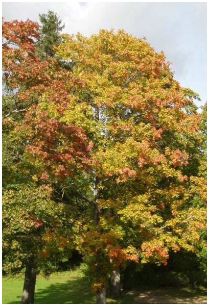
PUUD TORETSEVAS VÄRVIRÜÜS: Loodus valmistub talveuinakuks.