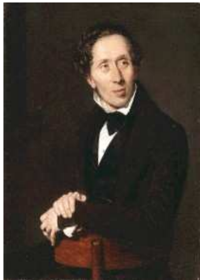
TÄHELEPANU KESKMES: Tuleval aastal möödub muinasjutuvestja Hans Christian Anderseni sünnist 200 aastat.

*töö autori ees- ja perekonnanimi, klass;