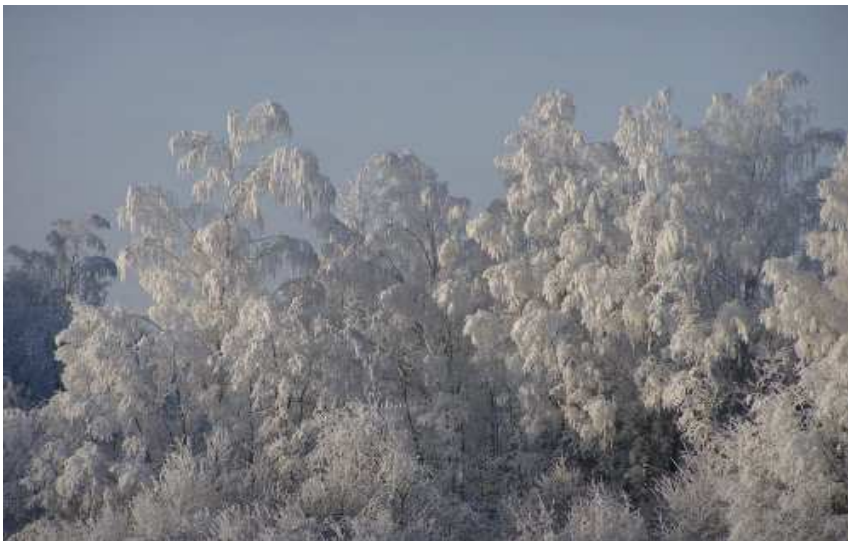
JÕULULUMMUS: Tuul oksid keerutab, neilt lumi langeb maha – on jälle talve alguspäev, taas täis on aastaring, kas tahad või ei taha...

Virve Tamm Laevast valiti kolleegide poolt parimaks lk 2