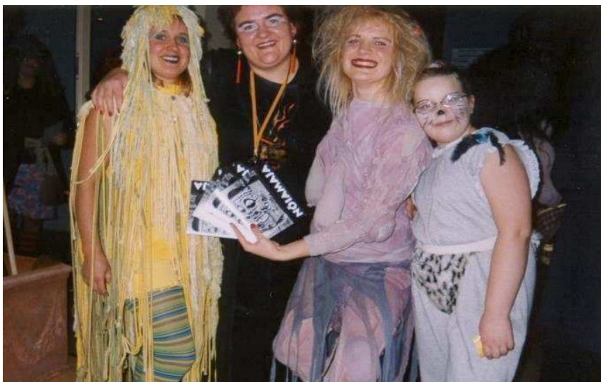
TEADJANAISED: Tartu Maanaiste Liidu kutsel kogunes Tartu vallamajja 29. oktoobri õhtul väga omapärane seltskond – oli murueide tütreid, oli mustlasi...

Kõik külalised võeti vastu sooja kallistuse ja pisikese nõialiku kingitusega.