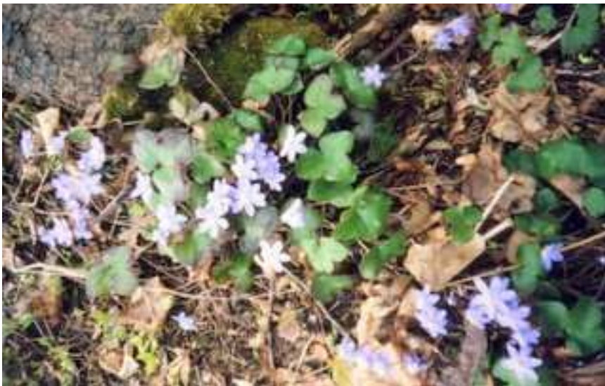
TASUB TEADA: Rahvatarkuse varasalves on hoiatav tõdemus, et kui külm kevadel õied ära võtab, siis võtab ta sügisel vilja ära.