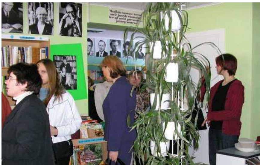
IMETLUSVÄÄRNE TULEMUS: Kolleegid Võrumaalt leidsid, et Melliste raamatukogu ruumide uuendamise lugu vääriski raamatut.

Luunja Raamatukogus, mis avati pidulikult 19. novembril 2003, on tuntav mõisamaja hea aura, mis iseenesest kutsub raamatuid riulilt võtma ja lugema. Jääb