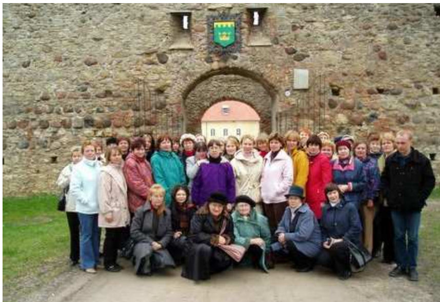
SIIN ME OLEME: Ekskursiooniseltskond on jõudnud sihtpunkti – Põltsamaale.

„Raamatukogud on oma olemuselt küll kaunis ühtemoodi asutused, kuid siiski on alati kõikjalt midagi õppida,“ kuulub bussis kellegi häälekalt lausunud arvamus. „Mina tajun tavaliselt juba riulite paigutusest, kui loov isiksus on konkreetne raamatukoguhoidja.“ Vastremonditud Tabivere raamatukogust jäi kõnelejale silma, et suisa välisukse läheduses tervitab sisenejat luuleriul. „Hea idee, edaspidi tasub endalgi riulid sedasi seada, et luule väärtust inimeste silmis esile tuua.“ Kolleegide töid ja tegemisi uudistati ka Jõgeva linnaraamatukogus ja Põltsamaal asuvas maakonnaraamatukogus. Ülevaade meie raamatukoguhoidjate Jõgevamaa väisangust kajastas tänu reporter Kaie Nõlvakule „Vooremaa“ veergudel. Toivo Ärtis