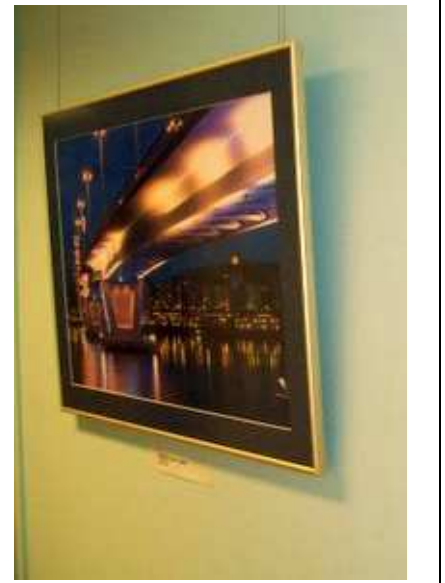
PILDIMEISTER: Soome tunnustatud fotograaf Markku Könkkölä.