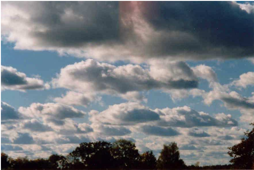
PILVED LENDAVALD MEIL ÜLE PEA: Taevalaotust on pildistanud Eve Toots.